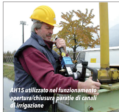
AH15 utilizzato nel funzionamento apertura/chiusura paratie di canali di irrigazione